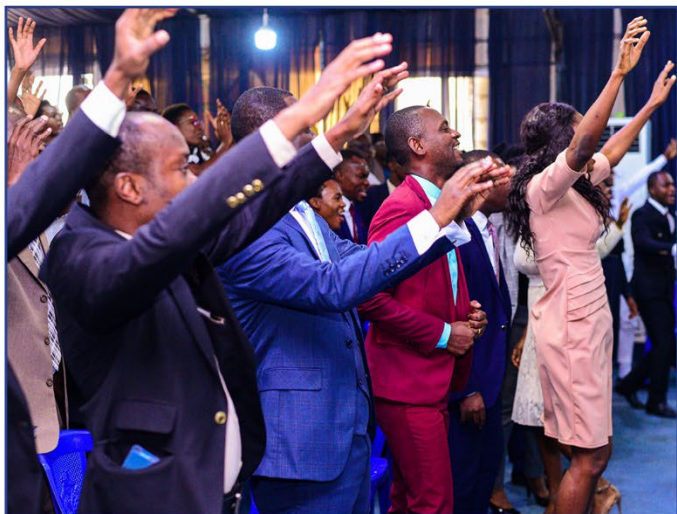
Mouvement Final Global : Un Jésus, Un Corps du Christ, Un Mandat

Chaque enfant de Dieu a été fait pour un but, et il y a un ministère ou un berger que Dieu a choisi pour lui ou elle pour accomplir ce but (Jérémie 3 :15).